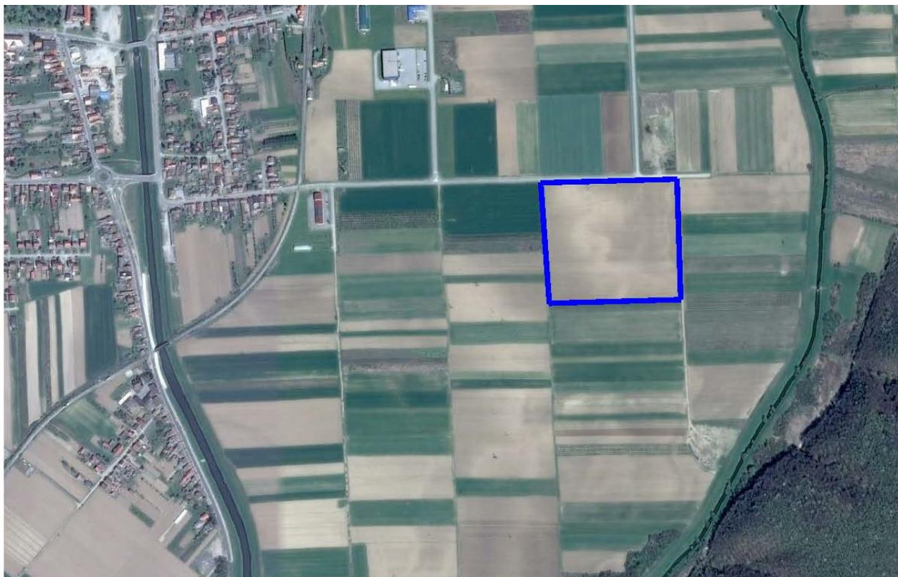
Lokacija poljoprivredno-gospodarske zone unutar gospodarske zone Pleternica II izvan naselja - ortofoto

Istočno od planirane lokacije poljoprivredno-gospodarske zone je prema PPUG Pleternice planirana nova brza cesta (državna cesta) – istočna obilaznica Pleternice. Člankom 72. PPPSZ je preporučeno da minimalna udaljenost građevina za uzgoj životinja od ruba zemljišnog posjeda planirane brze ceste iznosi najmanje 200 m, ali je dozvoljeno da se iznimno u PPUG mogu odrediti i manja udaljenost od 200 m, za što je potrebno navesti argumentirano obrazloženje, kao i razlog i potrebu planiranog odstupanja od preporuka iz PPPSZ.