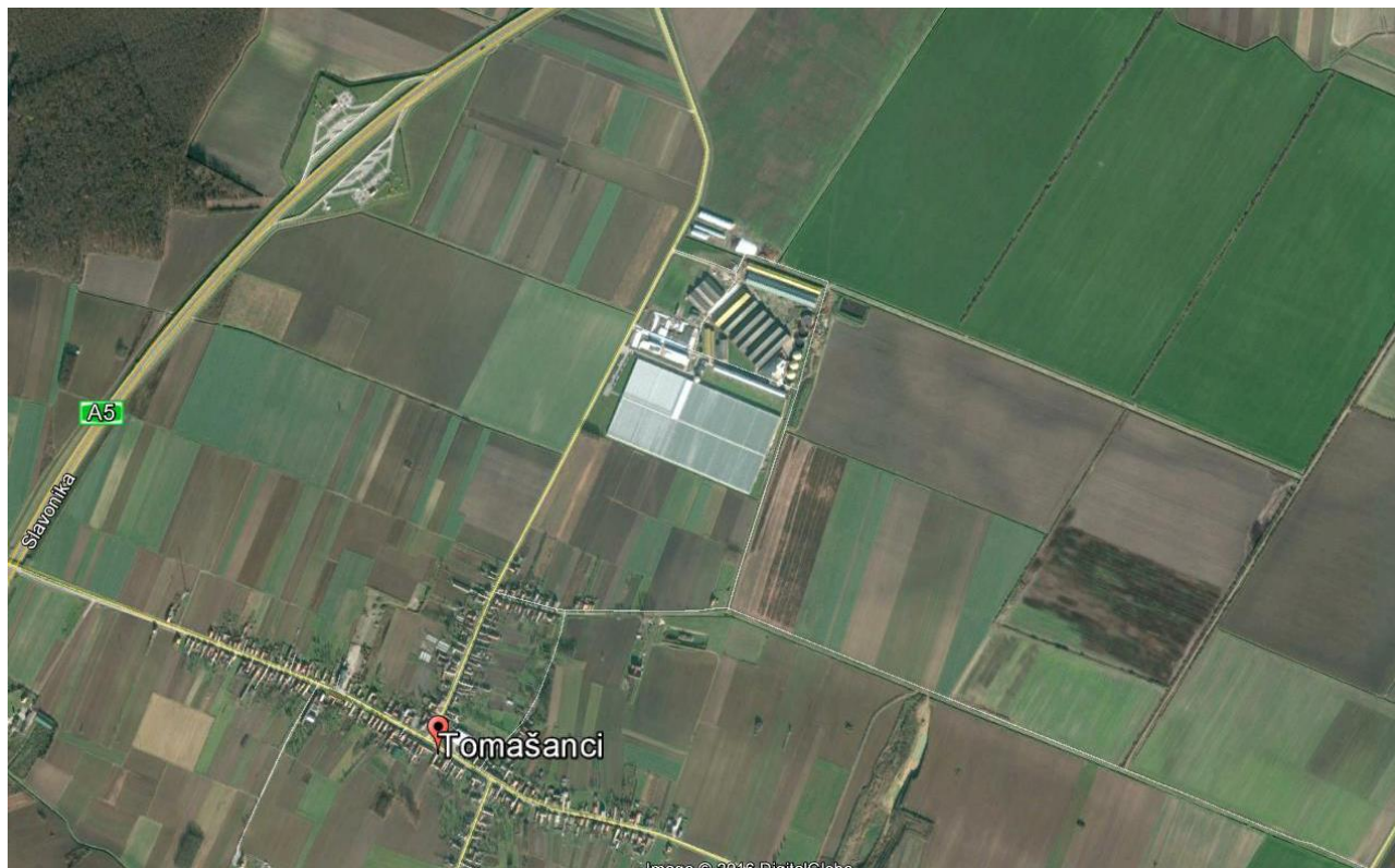
Farma za tov junadi i bioplinsko postrojenje Tomašanci (situacija)