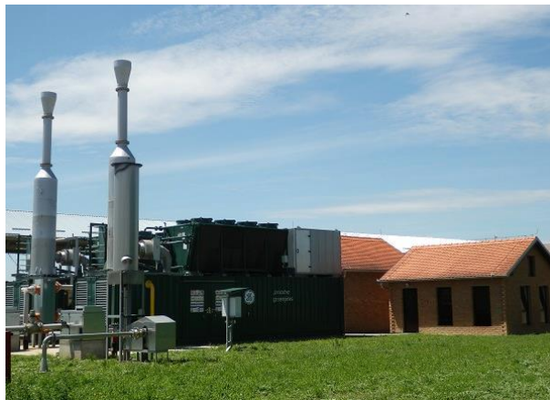
Generatori (plinski motori)